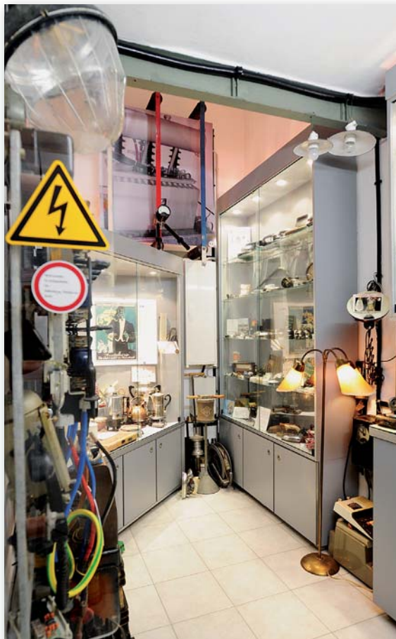
Abb. 3: Klein, aber fein: Zahlreiche Ausstellungsstücke finden sich im Kleinsten Strommuseum der Welt.

sehr wertvollen Schaustücken, darunter der leuchtende Stopfpilz von Altbundeskanzler Konrad Adenauer, alte Brennscheren zur Haarpflege, Stromprüfer und vieles mehr. Dass dieses alles eine tolle Idee ist, fand auch das „große“ Strommuseum in Recklinghausen, mit dem der Turmverein Damm kooperiert und so auch Wechselausstellungen anbieten kann. Damit der Verein buchstäblich in „aller Munde“ ist, erfreuen sich die Turmprodukte großer Beliebtheit. Es gibt Turmbräu Pils, Turmschnäpse, Turmbrot, Turm-