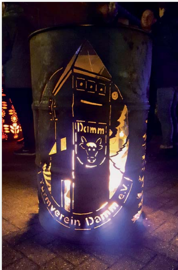
Abb. 4: Der Turmverein feiert auch gern: Im Sommer gibt es ebenso ein Fest wie im Winter. Beim „Turmglühen“ wärmen sich die Gäste am stilvoll illuminierten Feuerkorb.

käse und Turmsalami. Für Modelleisenbahner gibt es den Turm als Kartonmodell-Baubogen zum Nachbauen in den Spurrößen H0, TT, N und Z.